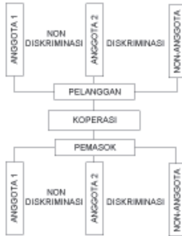
Gambar 2. Diskriminasi oleh Koperasi